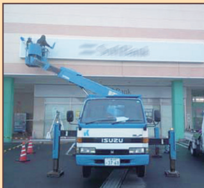
看板面クリーニング作業