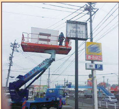
蛍光管取換え作業

看板のクリーニングや電球交換は、 なかなか面倒ですよ。 やっぱり餅は餅やで... 看板のことは看板屋にお任せください。